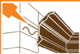
บัวเพดาน