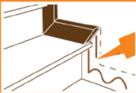
บัวบันได